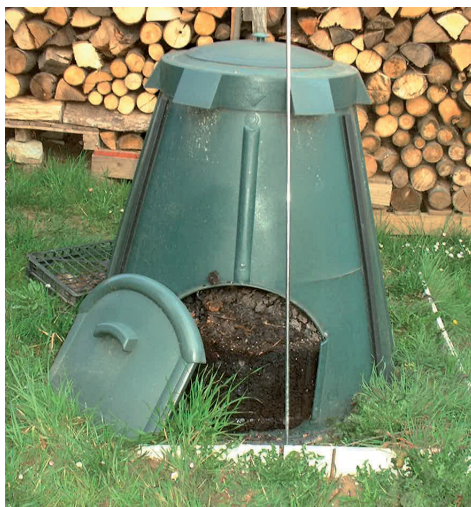
archivio E.R.I.C.A. 2005

D'altra parte molte città o regioni hanno già messo in campo azioni di prevenzione, mentre altre sono praticamente al punto zero.