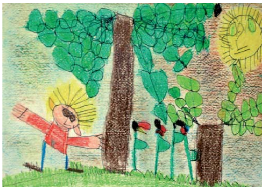
Disegno selezionato dal Concorso "Disegno l'Ambiente – Anno 2005" Scuola Comunale dell'Infanzia "Mario Pasi" – VI Sezione, Ravenna

Non vanno dimenticati infine i prestigiosi patrocini della Regione Emilia Romagna, del Consorzio del Parco Regionale del Delta del Po e del Centro Servizi Amministrativi di Ravenna (ex Provveditorato).