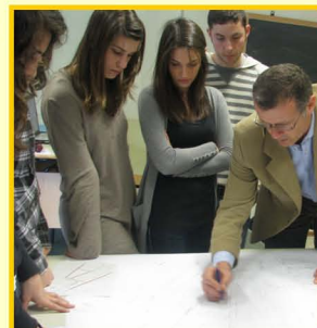
Istituto Tecnico per Geometri C. Morigia - progettazione