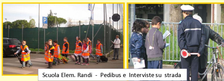
Scuola Elem. Randi - Pedibus e Interviste su strada