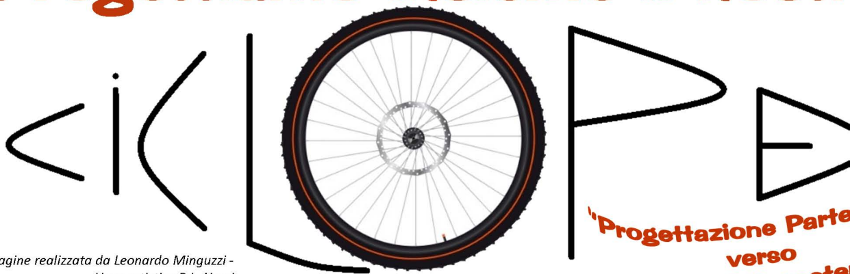
Immagine realizzata da Leonardo Minguzzi - Liceo artistico P.L. Nervi

Il progetto nasce dalla proposta avanzata dalla Regione Emilia Romagna riguardante la riqualificazione di percorsi sicuri casa-scuola da progettare con metodologie partecipative.