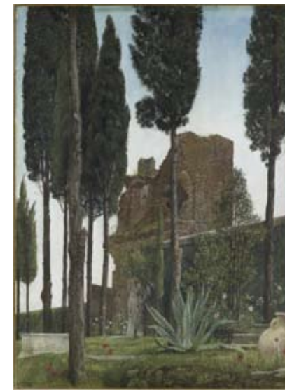
Walter Crane, la tomba Shelley Ashmolean Museum University of Oxford

MAR Museo d'Arte della città di Ravenna dal 28 febbraio al 6 giugno 2010