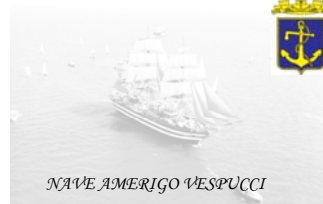
NAVE AMERIGO VESPUCCI