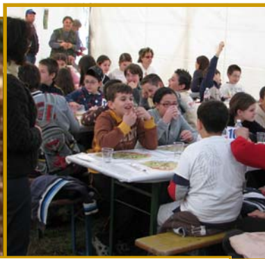
Degustazione dei ragazzi durante la Sagra del tartufo

In occasione della Sagra del Tartufo verranno concretizzate molte delle conoscenze maturate in aula durante una escursione guidata in pineta e una speciale degustazione per i ragazzi.