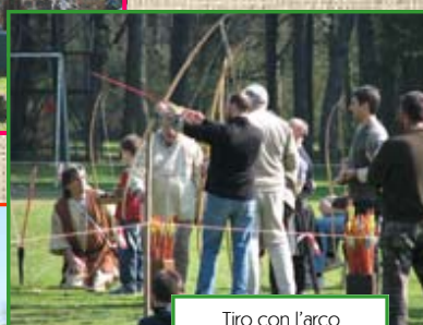
Tiro con l'arco