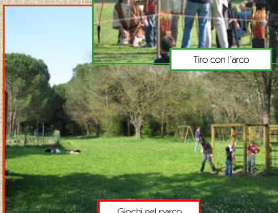
Giochi nel parco