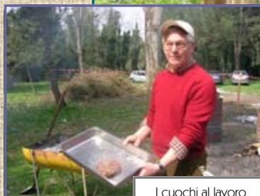
I cuochi al lavoro