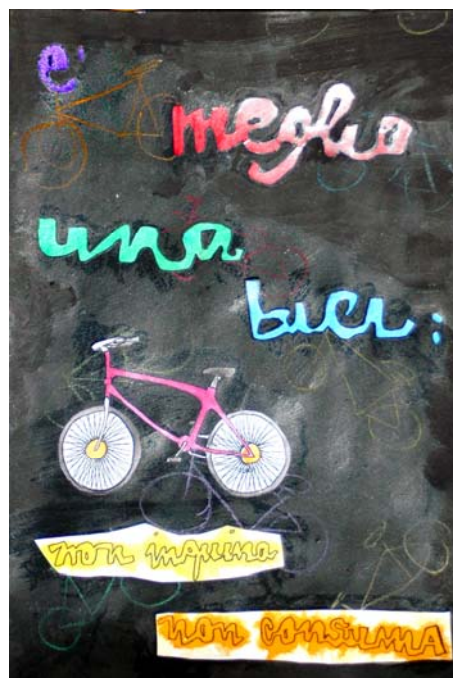
Disegno di una alunna del Liceo Artistico

Gli studenti nell'ambito del progetto sono stati portati a leggere criticamente il contesto in cui vivono e a rivalutare la bicicletta come mezzo di trasporto ecologico, socializzante, sportivo, appropriato non solo all'età ma anche all'ambiente urbano spingendoli a sperimentare il suo uso in chiave di mobilità sostenibile.